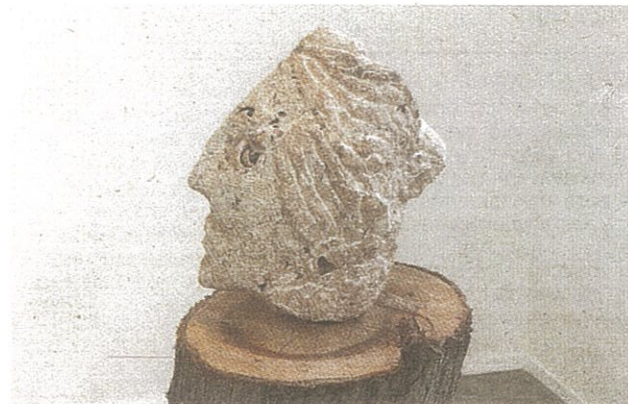
מרב קמל וחליל בלבין, "אוסקר", 2021