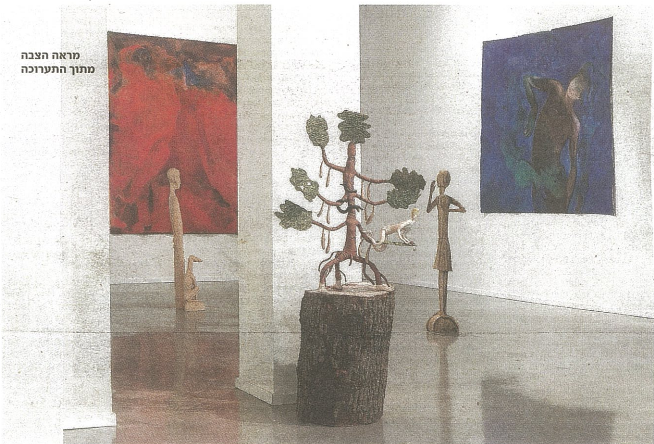
מראה הצבה מתוך התערוכה

המתח שבין אמנות פיגורטיבית בית לבין המופשטת הגיע לשיאו בשנות ה-30. מצד אחד של המ"ת רס עמדו האוצר והמנהל של המוזיאון לאמנות מודרנית בניו יורק, אלפרד באר, ואיתו פרשן האמנות קלמנט גרינברג שהיללו את הייחודיות המדיומלית של המופשט הטהור. מן העבר השני ניצב היסטוריון האמנות מאיר שפירו שטען טענה כפולה. ראשית, כבר בפתח המאמר "טבעה של אמנות מופשטת" שנכתב ב-1937 כתגובה לטקסט שליווה את הקטלוג של התערוכה המכונה "קוביזם ואמנות מופשטת" שנכתב בצרפת, כתב שפירו: "בטרם היתה קיימת אמנות של ציור מופשט, כבר האמינו רבים שערכה של תמונה הוא עניין של צבעים וצורות בלבד". כלומר, אין חדש תחת השמש, ובני אדם ציירו ופיסלו צורות מופשטות מאז ומעולם. שנית, טען שפירו, גם ריכוז, עיגול, קו, כתם, הם